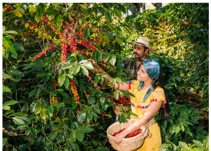
"Recolectores de café, Veracruz, México".